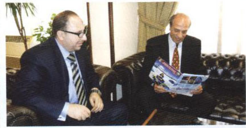
أجرى الحوار :

وزارة الصحة ( مراقبة الأغذية قانون ١٠ لسنة ١٩٦٠ ) وزارة الصناعة والتجارة الخارجية (الهيئة العامة للرقابة على الصادرات والواردات القانون ١١٨ لسنة ١٩٧٥ واللائحة التنفيذية لسنة ٧٧٠ لسنة ٢٠٠٥ )، وهي الجهة التي تعمل تحت مظلتها كافة الجهات الرقابية طبق للقوانين والقرارات والتشريعات المنظمة لذلك.